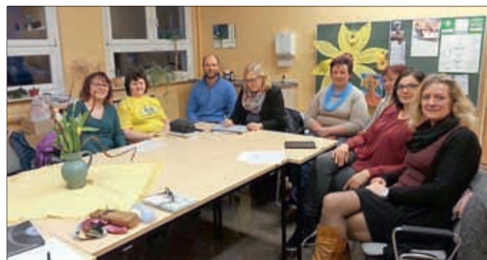
Vertragsunterzeichnung am 07.03.2018 in der Grundschule Katzhütte

Lehrer, Erzieher, Elternvertreter und Mitglieder des Schulfördervereins trafen sich am Mittwoch, dem 07.03.2018, um die überarbeitete Vereinbarung zu unterzeichnen.